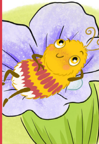
ILLUSTRATION Scarlett Minz